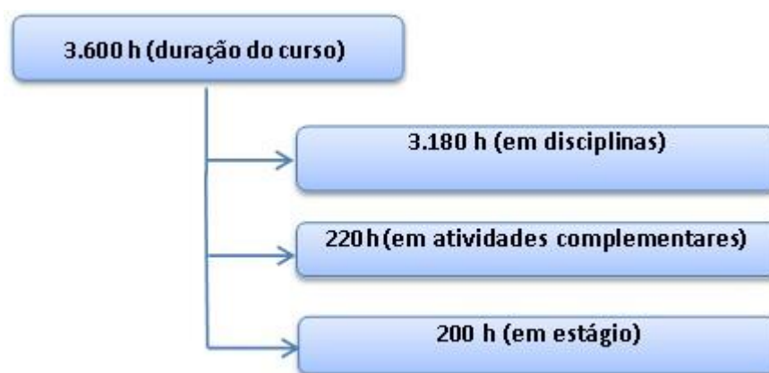
Figura 4 - Plano de integralização da carga horária

Quanto ao conceito de hora-aula, utiliza-se o quantitativo de 60 minutos. Deste modo, a organização geral do currículo apresenta-se conforme a Figura 4.