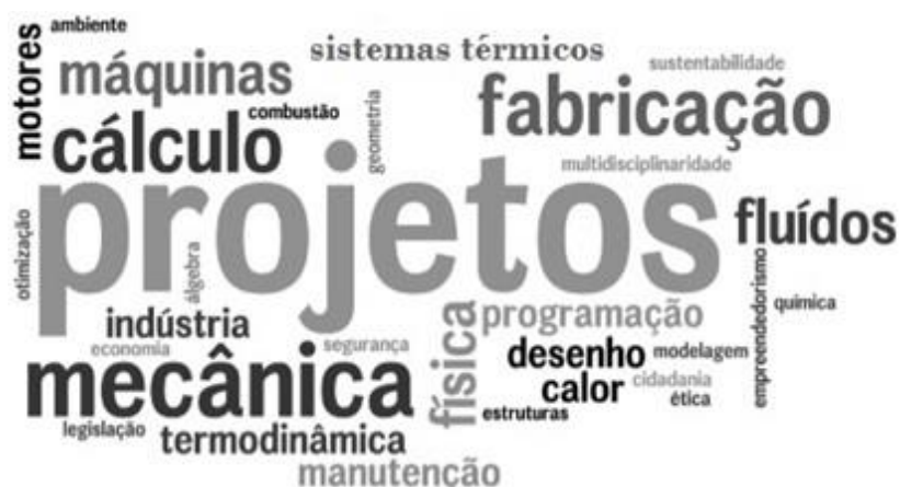
Figura 3- Nuvem de palavras segundo a matriz curricular.

MINISTÉRIO DA EDUCAÇÃO SECRETARIA DE EDUCAÇÃO PROFISSIONAL E TECNOLÓGICA INSTITUTO FEDERAL DE EDUCAÇÃO, CIÊNCIA E TECNOLOGIA DE MINAS GERAIS CAMPUS AVANÇADO ARCOS Avenida Juscelino Kubitschek, nº 485 - Bairro Brasília - Arcos - Minas Gerais - CEP: 35.588-000 (37)3351 5173 - ensino.arcos@ifmg.edu.br