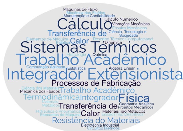
Figura 3- Nuvem de palavras segundo a matriz curricular.

Por fim, apresentam-se na Figura 3 os termos mais comuns, segundo os conteúdos didáticos da matriz curricular, previstos no perfil de formação do egresso em engenharia mecânica.