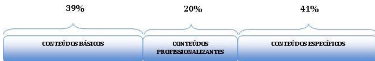
Figura 1- Distribuição de conteúdos

Em conformidade com as DCNs para os cursos de engenharia (BRASIL, 2019), a matriz curricular do curso de engenharia mecânica tende a uma distribuição aproximada de conteúdos conforme apresentado na Figura 1. Representam-se graficamente os conteúdos da matriz curricular para o perfil de formação no Apêndice A (pág. 154).