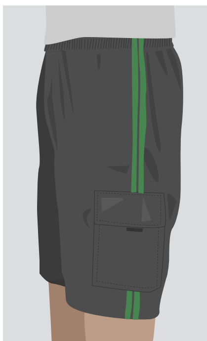
» Bermuda poliéster preta ou cinza com listras verdes laterais (com ou sem bolso lateral)