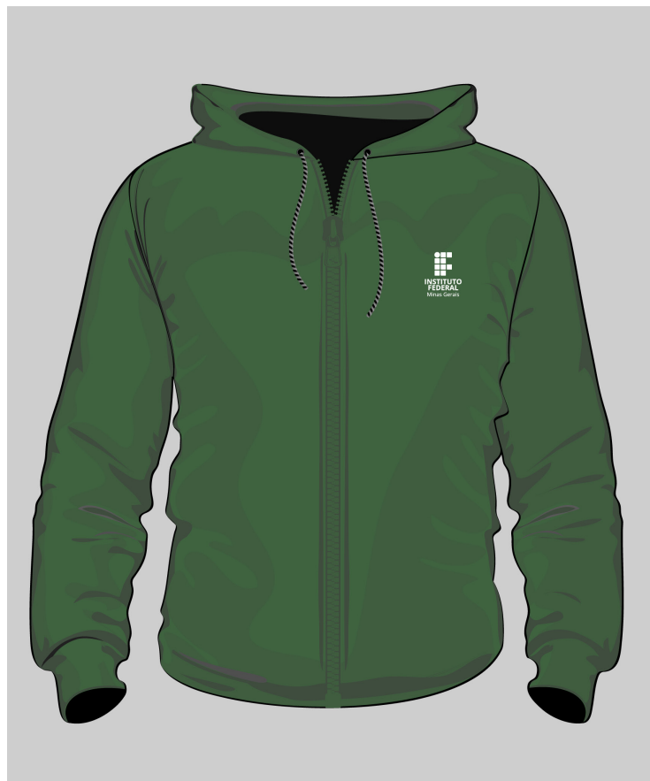
» Blusa de frio raglan moletom verde escuro com zipper