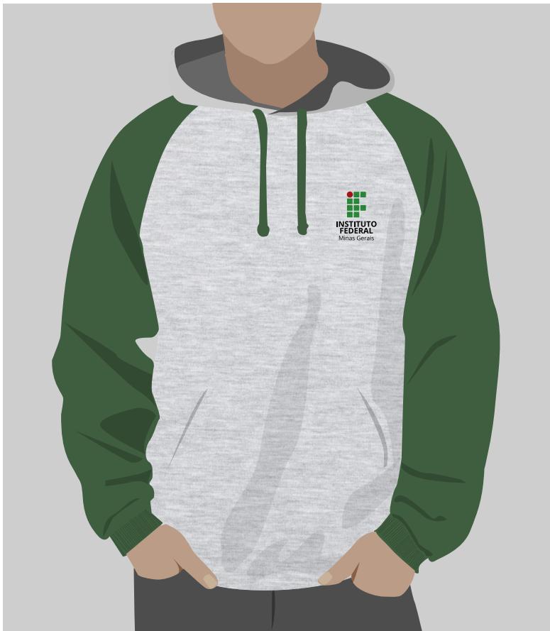
» Blusa de frio raglan moletom (cinza clara ou branca, mangas verdes escuras)