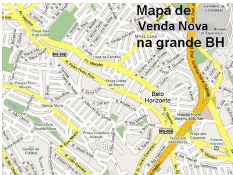
Figura 1 – Mapa de Venda Nova na Grande BH (Tamanho 12, espaço 1,5 entre linhas)

(Tamanho 10, sem negrito)