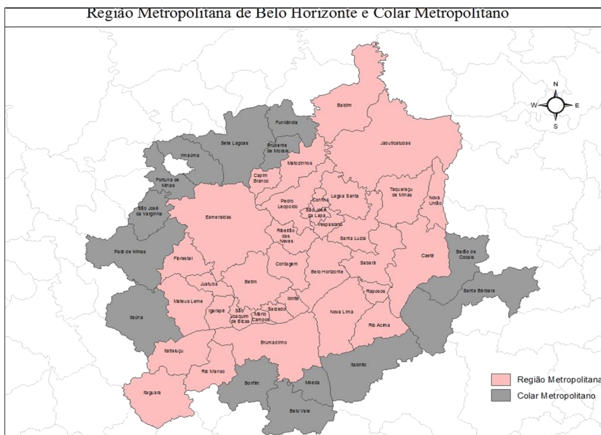
FIGURA 1– Mapa da região metropolitana de Belo Horizonte

Conforme a figura 1, o município de Ribeirão das Neves tem 155,4 km 2 de área e está localizado a noroeste de Belo Horizonte, a cerca de 32 km de distância da capital, ocupando aproximadamente 4,1% do setor norte da Região Metropolitana e tem por limites: Belo Horizonte, Contagem, Pedro Leopoldo, Esmeraldas e Vespasiano. As vias de acesso que servem ao município são a BR 040, MG 424 e MG 432.