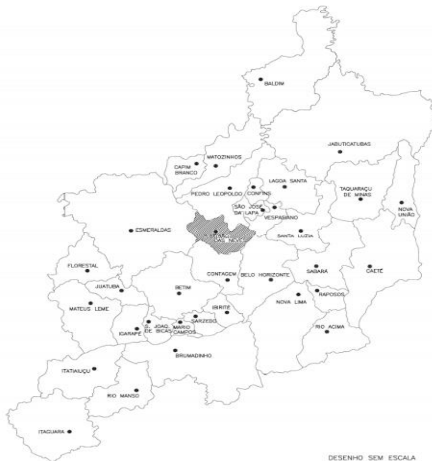
Figura 1: Ribeirão das Neves na Região Metropolitana de Belo Horizonte

Rua Taiobeiras - Fazenda Mato Grosso e Neves - Zona Rural - 169 – Sevilha (2ª Seção) – Ribeirão das Neves - Minas Gerais - CEP: 33.858-480 (31) 3627-2303 - https://www.ifmg.edu.br/ribeiraodasneves