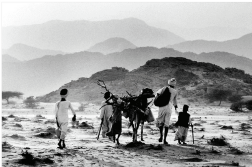
Êxodos. Sebastião Salgado.