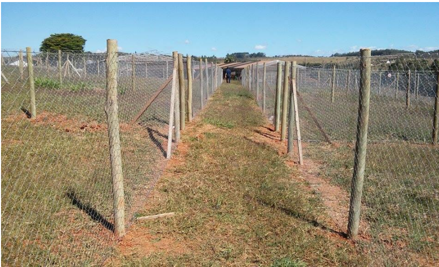
Figura 4: Piquetes em construção.