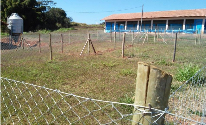
Figura 3: Piquetes em construção.