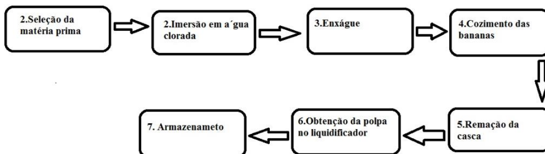
Figura 1. Fluxograma das Etapas de processamento da biomassa

A bananas caturra, foram lavadas com água e detergente neutro e higienizadas com solução clorada. A biomassa foi obtida por cocção das bananas em tacho pelo tempo de 12 minutos e em seguida, foram descascadas e homogeneizadas em processador de alimentos com velocidade de rotação constante, por 5 minutos, conforme descrito por Borges (2003). A biomassa foi processada de acordo com o fluxograma da figura 1.