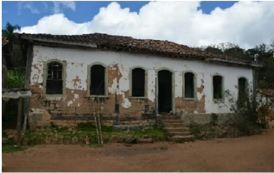
Figura 1: Fazenda Candoza – Foto da Fachada Frontal (BENINCASA, agosto de 2016)

Em análise inicial das somas dos bens e fortuna total (monte-mor, em réis) encontrados em 43 inventários de Peçanha, entre os anos de 1857 a 1886, concluímos que a sociedade da Mata do Peçanha, no período Imperial, era muito desigual, com um terço de inventariados podendo ser considerados pobres, com fortunas muito pequenas e médias baixas, ao mesmo tempo em que cerca de um sexto dos inventariados detinha a maior parte da riqueza do grupo. Além disso, podemos dizer que os grupos médios detinham certa expressão dentro do padrão de distribuição da riqueza local, concentrando cerca de um terço da riqueza total (SILVA; RIBEIRO, 2016).