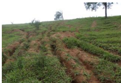
Figura 3 – Área de pastagem com grandes sulcos de erosão e pouca cobertura vegetal

Na Figura 3 é possível identificar sulcos de drenagem profundos na pastagem em uma área de alta declividade, em alguns trechos da sub-bacia foi apontado no diagnóstico presença de grandes voçoroca 5 .