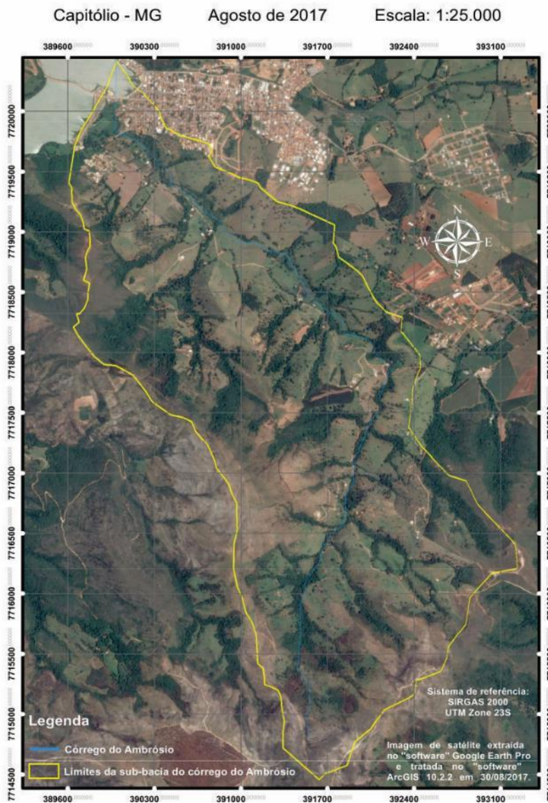
Figura 1 – Imagem georreferenciada da sub-bacia

Uma das principais causas de degradação das pastagens nas regiões de clima tropical e subtropical do Brasil são as práticas inadequadas de manejo do pastejo (Dias-Filho, 2011). As áreas de recarga e de