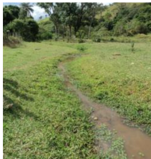
Figura 2 – Curso da água no trecho mais degradado

proteção hídrica encontram-se dominadas pela atividade pecuária. A Figura 2 apresenta o cenário de escassez de cobertura vegetal e da redução nível do córrego.