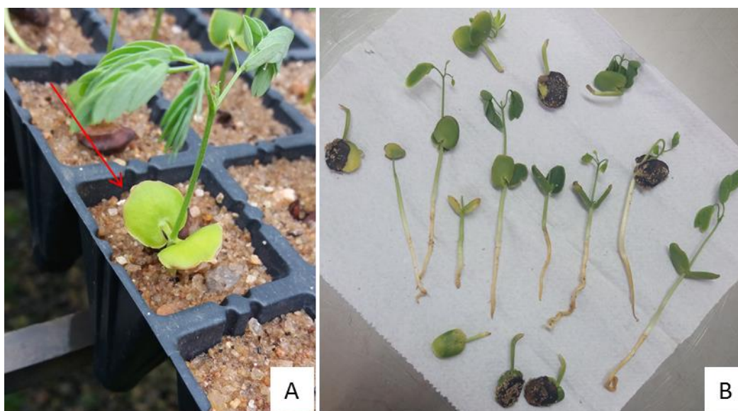
Figura 2. A) Plântula com sintoma de amarelecimento e queima de cotilédone (seta). B) Plântulas com diversos sintomas ocasionados pela presença do patógeno, como má formação de plântula e raízes, amarelecimento e lesões nos bordos de cotilédones e raízes.

Ao avaliar as plântulas sintomáticas, para ambas as espécies florestais, foi identificado com maior frequência, o fungo do gênero Fusarium sp. BOTELHO et al. (2008), também afirmaram em seu trabalho que os gêneros Alternaria , Phoma , Fusarium , Aspergillus e Phomopsis , presentes em sementes de ipê-amarelo e ipê-roxo, possuíam a capacidade de causar sintomas de manchas em raízes. Segundo trabalho realizado por Lazarotto et al. (2012), o Fusarium sp. foi capaz de ser transmitido via semente para a VIII Seminário de Iniciação Científica do IFMG – 12 a 14 de agosto de 2019, Campus Ribeirão das Neves.