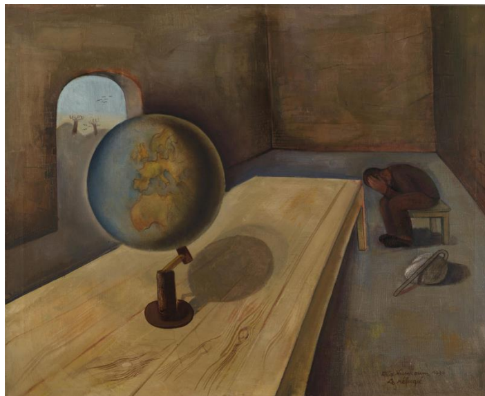
Figura 2: Felix Nussbaum, 'O refugiado' (1939).