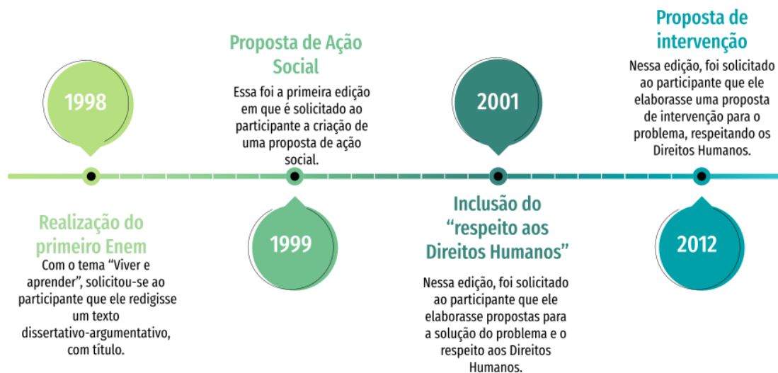
Figura 1. Variações da Proposta de Intervenção Social.