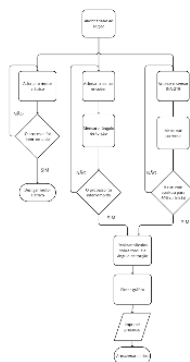
Figura 1 – Fluxograma do Código de Controle

O fluxograma é uma ferramenta prática e simples para organizar processos, pois mostra de forma visual cada etapa das atividades. A Figura 1 traz um exemplo de fluxograma que representa como o código computacional funciona: desde o início do ensaio de torção até ao seu encerramento. No final do ensaio, os dados coletados são salvos e é produzido um gráfico que relaciona o ângulo de torção com a deformação específica por torção.